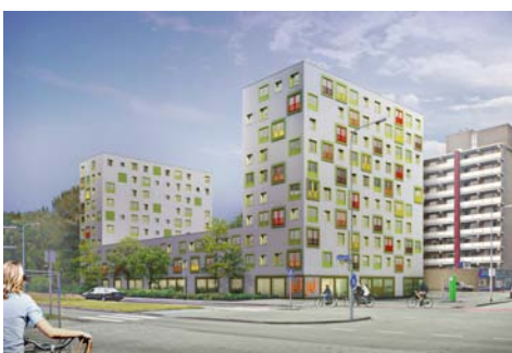
Zonnelaan Groningen i.o.v. Schutte Vastgoed i.s.m. De Huismeesters