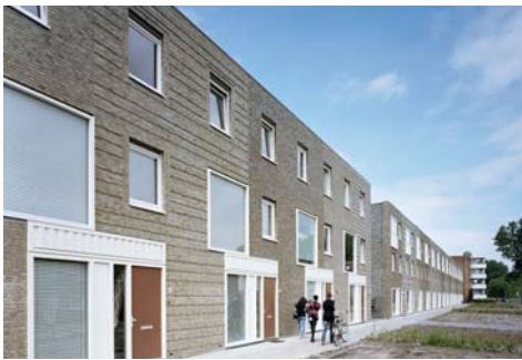
Bonairestraat Groningen i.o.v. Lefier Stad Groningen