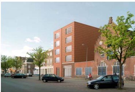
Boterdiep Groningen i.o.v. De Kroon Vastgoed