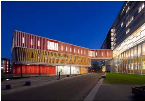
Paviljoen voor het WSN-gebouw i.o.v. Rijksuniversiteit Groningen, afd. VGI